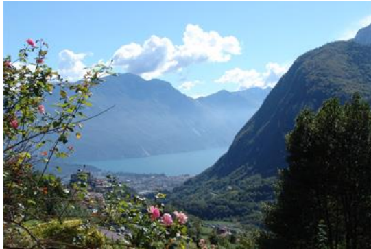
Blick zum Lago di Garda

in den Bergen des nördlichen Gardasees – Tenno, Trentino