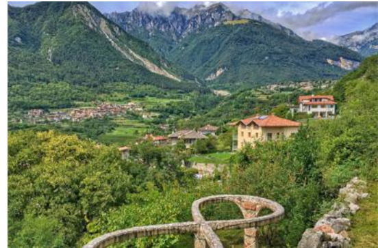
Blick zum Passo Balino