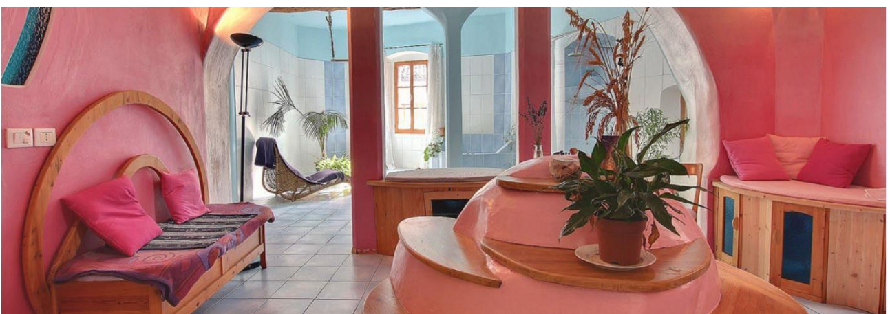
Das Casa della Bellezza, das Haus der Schönheit, in Tenno wird im Rahmen der Reise besichtigt. Diese neu gestaltete, italienische Villa ist heute eine Art „Museum der Zukunft“. Die Innenarchitektur kann als eine Inspiration für eine zukünftige Wohnkultur angesehen werden.