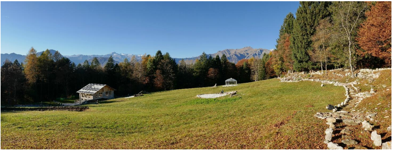
Blick auf „Naone“, mit Meditationshaus und Pavillon. Ein aus Steinen des Grundstücks gestalteter Weg führt rings herum und bietet einen weiten Ausblick auf die Trentiner Bergwelt.